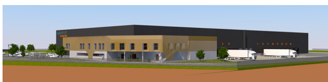
Visuel : Atelier jtG&caetera, architecte